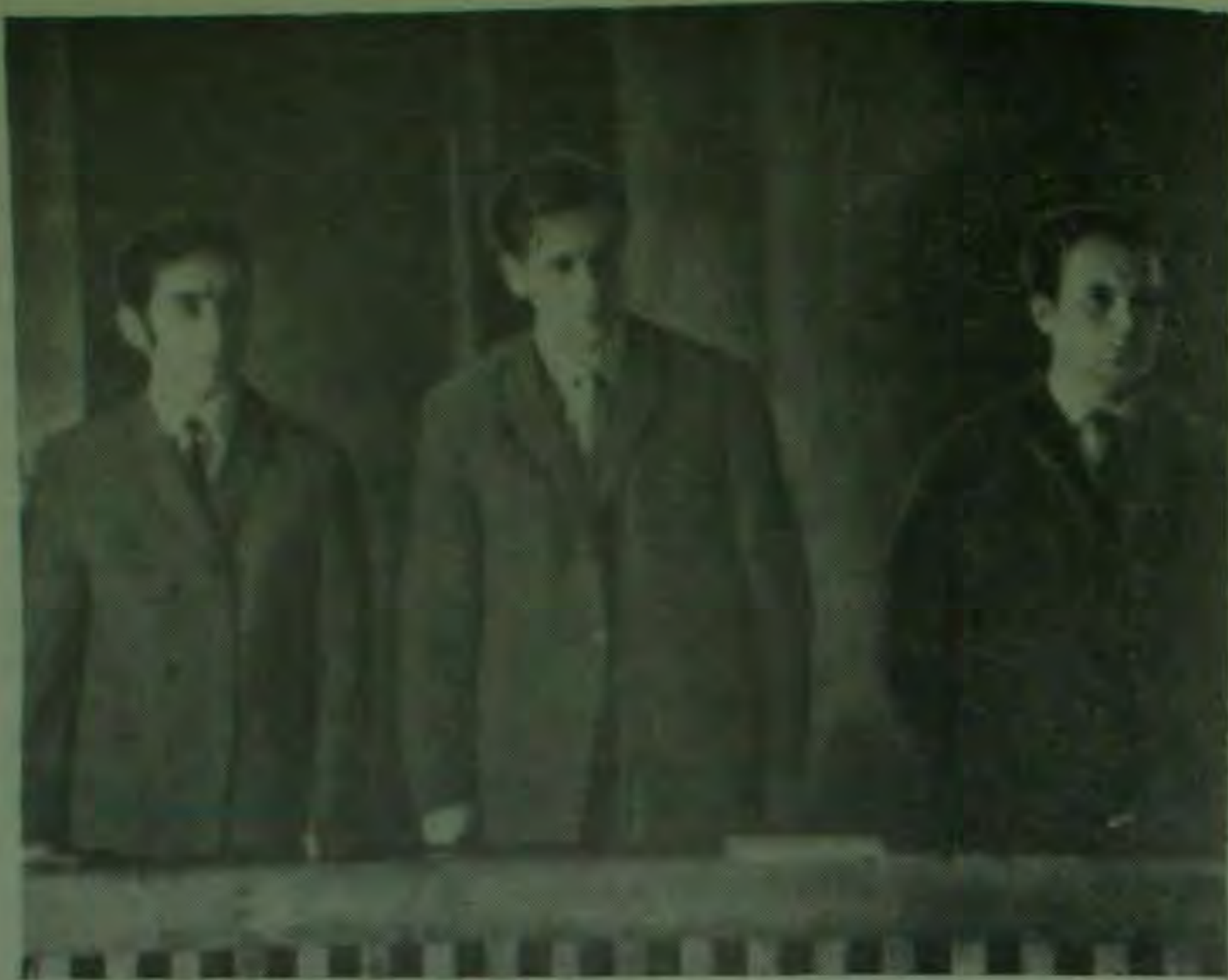
Boxa acuzaților. In mijloc Mircea Codreanu